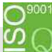
Certificazione ISO 9001:2000