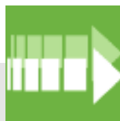
Garanzia di assistenza post-vendita