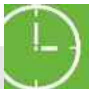
Tempi di consegna ridotti